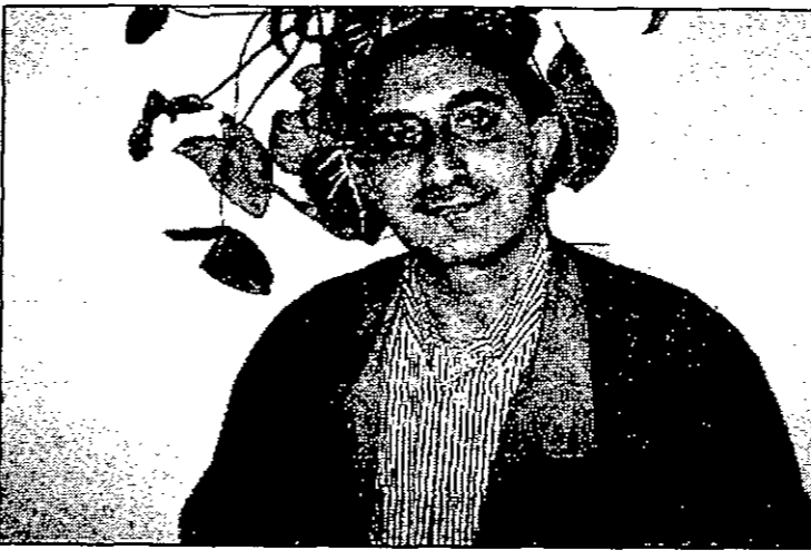
حاتم الصكر (القدس العربي)